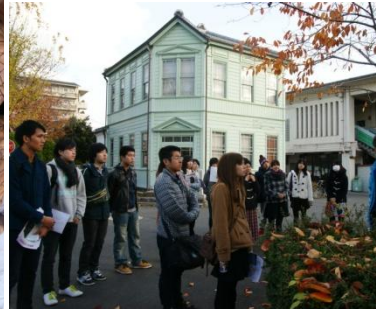
レトロな建物に秘められた歴史とは？