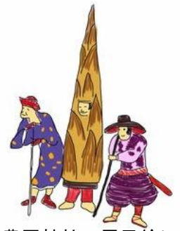
豊国神社の屏風絵に描かれた元祖ゆるキャラ・タケノコ男

NPO 法人京都景観フォーラム・七条プロジェクトチームです。 私たちは、世界遺産、寺社仏閣、博物館、大学が高度に集積する七条通界わい（東大路から JR 山陰線あたり）に注目し、百年前の京都三大事業が生んだ七条通と七条大橋の再生を考えるプロジェクトを進めています。その一環として、地域の皆さんとともに町歩きをします。ぜひご参加ください。