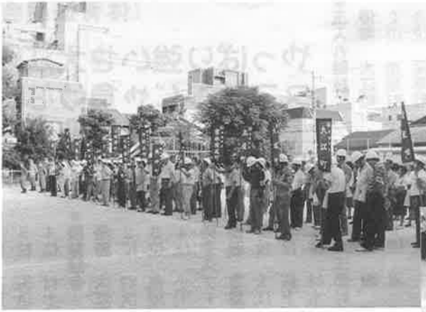
▲元修徳小学校のグラウンドに勢揃いした各町内の担架での搬送訓練に真剣に取り組むいざという時にも落ちついて行動できるようにと避難訓練(右下)

去る9月20日、彼岸の入り、例年の様に区民挙げての取組を致しました。 避難命令発令から20名の避難完了までに17分かかりましたが、訓練内容が濃くなり、負傷者を救出して避難する町内が8カ町もありました。 学校のグラウンド整列後、 ①会長挨拶等のセレモニー ②各ブロック毎の想定による負傷者手当と担架での安全場所への搬送訓練 ③消防署員からの三角巾諸取扱法と実技指導 ④給食配布訓練(今年は乾パン) ⑤修徳消防分団員の訓練披露 ⑥下京消防署長の講評と続き、午後3時50分、総り多き訓練を終了しました。あつてはならないことですが、災害は全く予期せずやってくるものです。そ