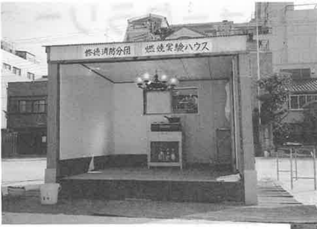
消防分団員力作の燃焼実験ハウス、左半分が耐火構造になっています(上)。テンブラ油の過熱により出火、またたく間に炎が上がり(右)。下京消防署員による消火活動、きびきびとした動きで数分で鎮火(下・右下)。火災の恐ろしさを改めて感じますね。