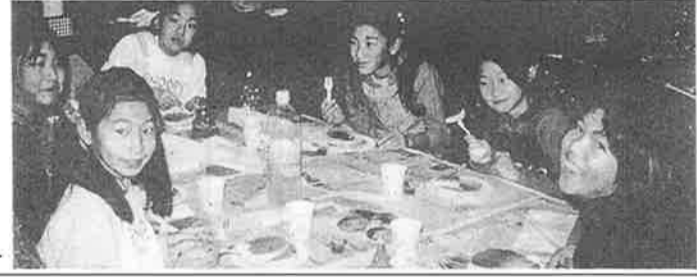
自分で焼いたホットケーキ、ひと味違う

みけ二百二人にもなり、少補委員、保護者の手伝いを含めると、二百七十名程度の人たちの参加がありました。これほど多数の参加は初めてのことと、どうなることかと心配しましたが、子供たちは、とても楽しんで、思い思いのクリスマスツリーに夢中で取り組み、完成させていました。それに、自分で焼いて食べるホットケーキはひと味違って、いっそう美味しく感じたことと思います。当日お手伝いくださいました少補委員、保護者の皆様、お疲れさまでした。 プラネット担当 福井祥恵