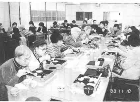
美味しい! 43名の舌つづみ