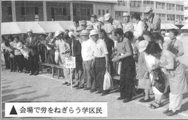
会場で労をねぎらう学区民

平成十四年度 総会開催される すでに、平成十四、五 年度の役員人事は、評議 員会で決定していた(広 報紙「修徳」四十八号既 報)。 今年度の総会は平井自