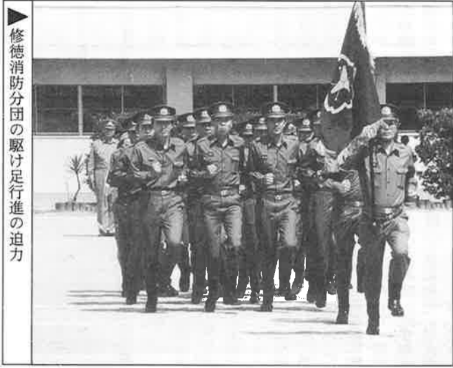
修徳消防分団の駆け足行進の迫力