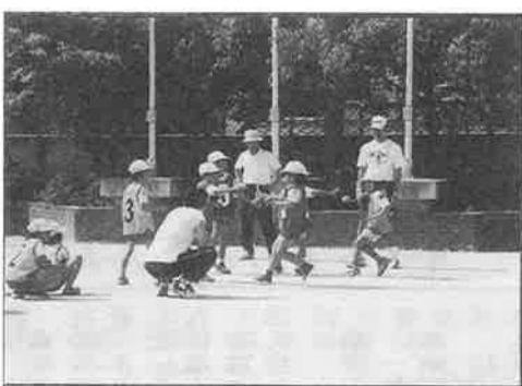
▲ミニ運動会/カラフルなゼッケンつけて?