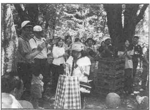
▲ゲームラリー/ハム太郎もいたとが??

サブタイトルが、『ドキ2 わく2 アニメヒーローに会えるかも?!』ということで、七支部それぞれ