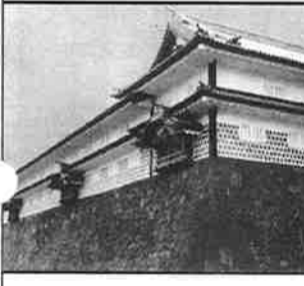
五十間長屋 普段は倉庫。非常時塔。鉄砲狭間が見える。