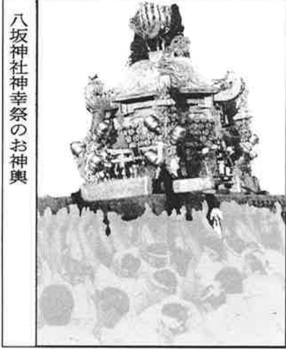
八坂神社神幸祭のお神輿

橋のなかつた昔は、ジヤブジヤブ……。松尾大社の祭では今も舟で渡られる。大阪の天神祭も、もちろん舟で。