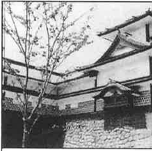
菱櫓 二の丸で一番高い三層の物見櫓。華やか。