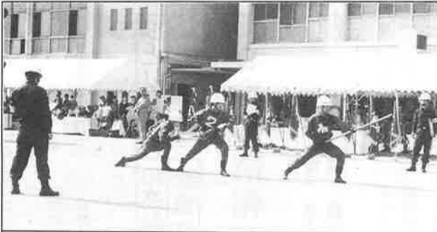
ポンプとホース操作の俊敏さ

まれる「結論」を出され れば最大限それを尊重し たいと存じております。 就任早々、新方針に、 I-Tによる双方向の情報 交換を重視した施策を採 用したのも、そのような 発想に基づくものです。 各委員会団体の機能は物 の還元だけでなく、対象 の方々との交流と情報の 交換に重点を置いていま す。それを蓄積し、学区 の防火防災、防犯、環境 改善などに役立てるI-T 共同体が、連合会の一つ の展望でもあります。