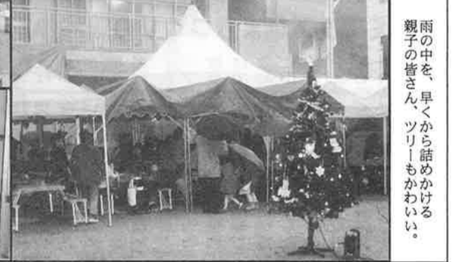
雨の中を、早くから詰めかける親子の皆様、ツリーもかわいい。