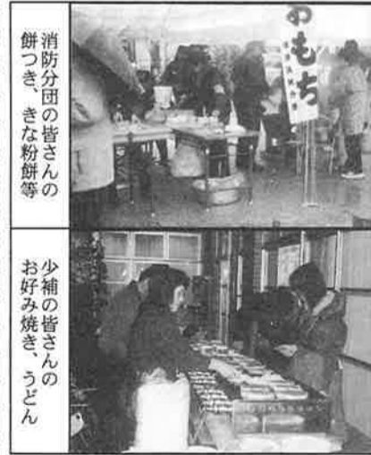
消防分団の皆さんの餅つき、きな粉餅等