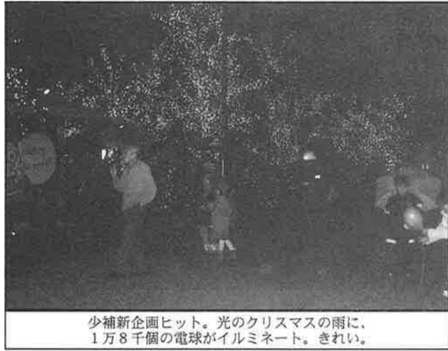
少補新企画ヒット。光のクリスマスの雨に、1万8千個の電球がイルミネート。きれい。