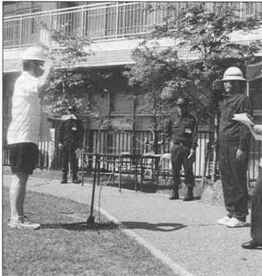
↑ 現地対策本部がすぐ設置され、機能した。各町防災部長の情報が的確に入ってくる。

今年も、総合防災訓練は、『現地災害対策本部』の設置から始まった。大地震が発生した時、自主防災会の組織が生き残っているかどうかは、『現地災害対策本部』が一時避難場所の修徳公園に、素早く設置できるかどうかにかかるといえる。『現地災害対策本部』が機能していないと、自主防災活動はできないし、自分たちの『まち』を守ることができない。