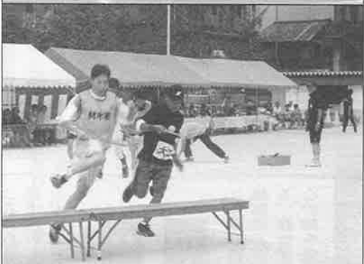
(上) アベック競走はビーチボールを胸に挟む (下) ポールキャリアー競走、これで落ちない？