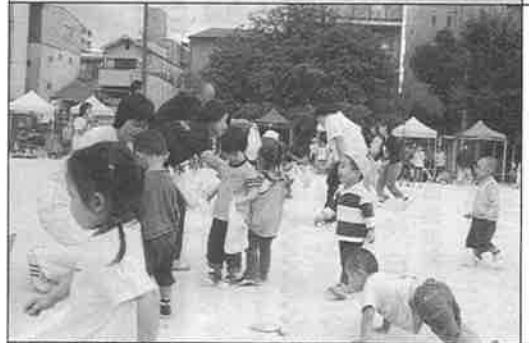
前方の役員さん、園長先生のお菓子へまっしぐら