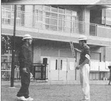
(上) 各避難家族が安否を記入 (中) 通報効なく自主防災活動 (下) ブロック長へ救援指示