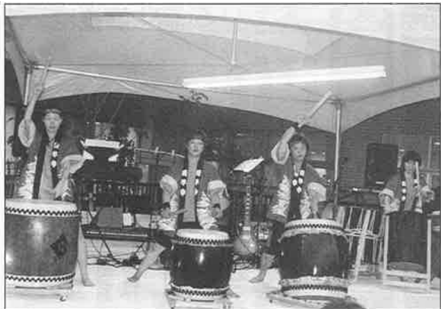
和太鼓は郷愁を誘うのか、洋楽のバンドに重ねると心に響く。新鮮さも好評だった要因だろう。

今年、徳万町の通りが、「歩行者天国」となった。その入口をイルミネーションで飾った。先日まで、東山の三寧坂から高台寺、円山公園までの夜の散歩道を彩った花灯笼が、通りに面してい