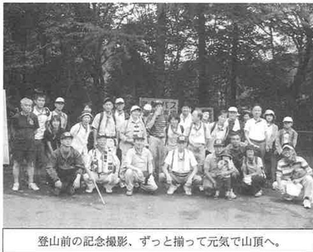
登山前の記念撮影、ずっと揃って元気で山頂へ。

の皆さんに再認識してもらった。毎年強調しているように、火災や倒壊など被害の種類別に、ブロック内で、被害の少ない町から多い町への救援を指示する。ブロック相互に、被害の少ないブロックが、被害の多いブロックへ救援隊を派遣する。