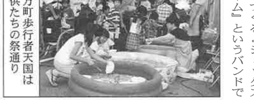
徳万町歩行者天国は子供たちの祭通り