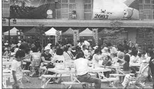
(下) 2003バック幕を背景に参加の皆さん