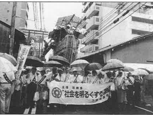
船鉾の引き初めに参加者、見物人に啓蒙のうちわ、ティッシュを配り、子どもたちには、ライフビスケツトが渡された。