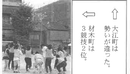
大江町は勢いが違った。材木町は3競技2位。