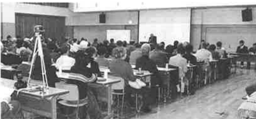
今後に生かしていくために、同じような災害を受

きた。」とその喜びを話した。井上先生は、「京都市をはじめ、全国各地の人たちに助けられたことに感謝の気持ちでやって来た」とことや、「家族や友人、そして、近所の多くの人たちが、地震で、なぜ、死ななければならなかったのか。この悔しい経験を、必死の思いで