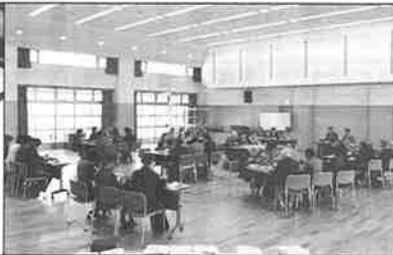
(左) 楽しく語り、心づくしの料理を味わう女性会の皆さんの手づくり料理の様子 (右) 楽し語り、心づくしの料理を味わう女性会の皆さんの手づくり料理の様子