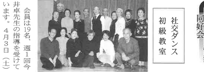
この勾配、APT式機関車が活躍