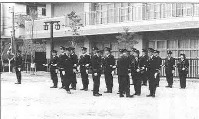
市長表彰が15回に達したということで、京都市消防団協会長の『特別羊頭授表彰』を受けた。分団旗には、この金色の『特別羊頭授』が一段と輝いている。