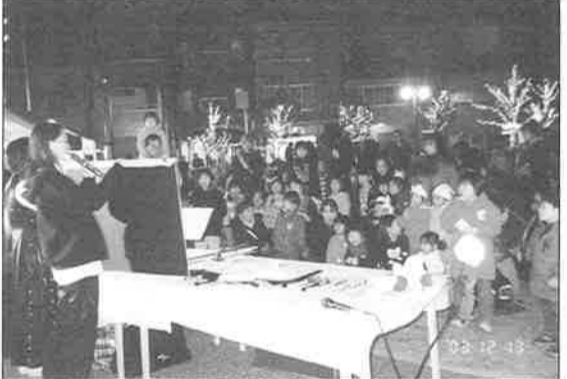
シヨックストームの皆さんの絵芝居、サンタの物語に子どもたちがこんなに集った。