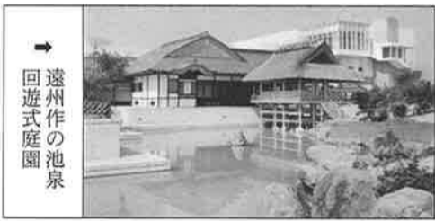
遠州作の池泉回遊式庭園

布屋町には「親和会」という旅行会がある。今年には19名が参加した。2月21日の土曜日8時半、五条若宮でサロンバスに乗り込む。浜松市内で昼食をとり、静岡県金谷町へ向かう。道筋は一面の茶畑で、予想を越えるスケールである。お茶の歴史博物館といえる『お茶の郷』に入る。庭園が美しい。パンフを見る。小堀遠州作の「池泉回遊式庭園の曲線と直線のコントラストがいい」とある。