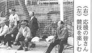
(右) 応援の皆さん (左) 競技を楽しむ

2月15日、せんだんホールに、ソフトバレーボール大会を開催しました。10チーム、50名ほどの若者たちが集まって、さわやかな汗を流して、楽しいひとときを過ごしました。