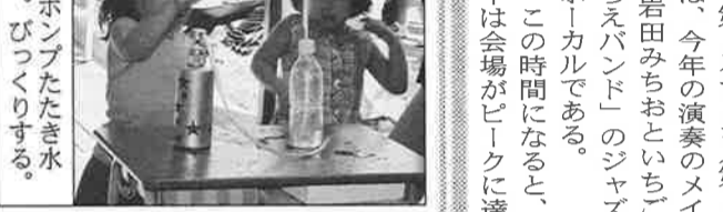
小空をポンプたき水吹かす。びつくりする。

今年、第1ステージ前に、「子どもフェスティバル」が先行する。「ヨーヨー投げ」「ダーツゲーム(的当て)」「水鉄砲(景品落とす)」「缶詰み(高さを競う)」「ポンプゲーム(ポンプで水を噴き上げさせる)」「たこせんべい」など多彩な遊びが「遊技場」「景品落とす」が並ぶ。