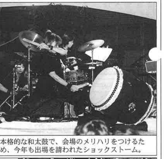
本格的な和太鼓で、会場のメリハリをつけるため、今年も出場を請われたショックストーム。