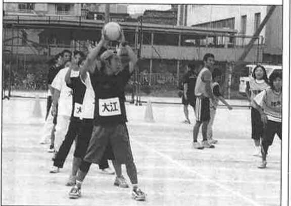
この玉送り競走、混合スプーンリレー、置替競走は大江町が優勝し強さを見せつけた。