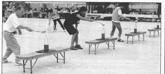
壮年レインボー競走は深草町が優勝。壮年活躍!

新団体競技の「壮年レインボー競走」が「玉入れ競技」とともに、大江町以外の町が優勝できる競技になっていて、採用してよかったと思つている。込み入った工夫のいる競技がもう一つあつてもいいとは思つが、各町も若いひとたちの参加が増えていることでもあり、チ