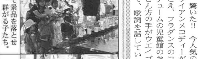
水鉄砲で景品を落とせるかな。群がる子たち。