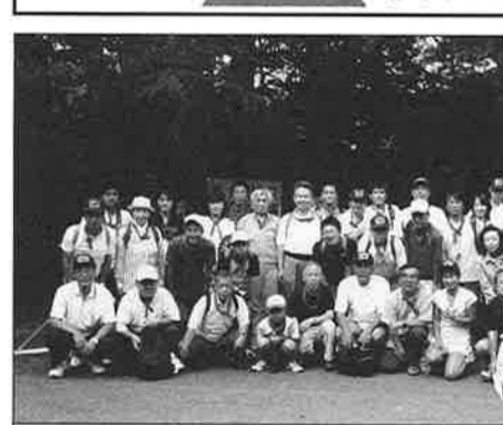
登山の記念撮影 登山の起点は清滝の名勝地 小学3年から77歳まで、39人が元気に参加