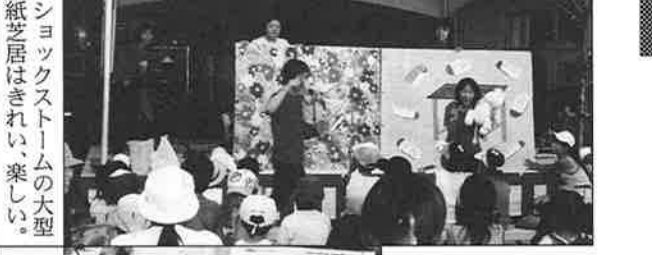
ショックストームの大型紙芝居はきれいで、楽しい。

今年、第1ステージ前に、「子どもフェスティバル」が先行する。「ヨーヨー投げ」「ダーツゲーム(的当て)」「水鉄砲(景品落とす)」「缶詰み(高さを競う)」「ポンプゲーム(ポンプで水を噴き上げさせる)」「たこせんべい」など多彩な遊びが「遊技場」「景品落とす」が並ぶ。