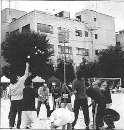
京都市長杯玉入れ競技は徳万町が、47個を入れ優勝した。

10月2日(日)の天気情報は午後雨であった。しかし、意外に明るい曇りである。このまま曇りのまま過ぎてほしいと、西の空を黒い雲がながれるのを見ながら、みんなが祈っていた。