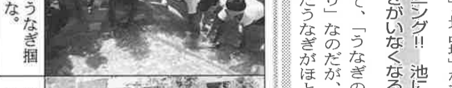
元気がうなぎ掘めるかな。