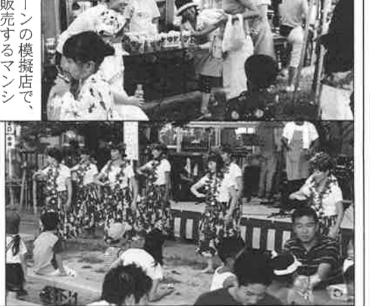
ポップコーンの模擬店で、笑顔で販売するマンシヨン町内会の皆さん。 児童館から人気のフラ