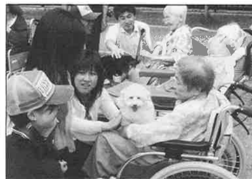
施設「修徳」の特別養護老人ホームのみなさんが癒しのワンちゃんと接して、自然に「かわいいね、かわいい、かわいい」の声を発した。マルチーズのかわいい顔がうれしい。

と木曜日は午後7時から9時まで、土曜日は昼間の2時から4時までですが、熱中している内にあつという間に終わってしまいます。 爽やかな汗を流した後、やっぱり思い切った出で来てよかつたなと思えます。順番を待っている間も楽しいおしゃべりで大笑いして、「家にもこんなふうに笑うことはないなあ」と、つくづく話しています。いつも美味しい給食を配ってくれる方がおられて、子どもに戻ったように日頃の疲れやストレスも吹飛びます。卓球のテクニクはもとより、人生の先輩方に教わることもとても多くて、無理をしないでやればきっと皆さんも仲良く長く続けていただけると思います。