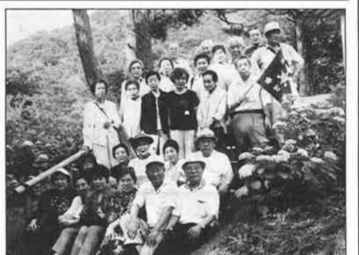
最終地あじさい園。5万本のアジサイとこの触れ込みでしたがこれが三分咲きくらいでしょうか。しかし、自然の地の利を生かした見どころは満開のときのすばらしさを、十分に想像できました。それにしても花に合わせた旅程のむずかしさ、某タレントじゃないがザンネン！。帰途はこれとれセンターで最後のお買い物。夏至に近い太陽に

参拝して遅まきながら智恵をいただく。船と散歩に分かれて私は歩く組に松林のオゾンに海の風。ところが途中にこんな看板が。「通学通学、歩行者の皆様へ」何月何日午前6時午後1時、ラジコンヘリにより薬剤散布のお知らせ。冬はともかくこんな環境のいい処を通学通学！これは一種の贅沢ですね。磯清水へ着くと、ここにも「松くい虫薬剤散布につき飲用禁止」。地元の苦勞とジレンマがわかります。