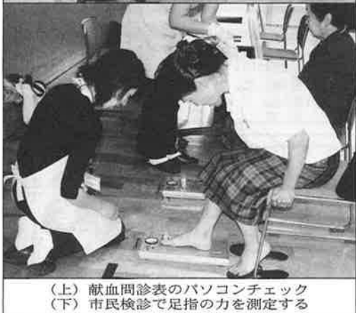
(上) 献血問診表のパソコンチェック (下) 市民検診で足指の力を測定する

友だちとの交流が認知症を予防する 2月21日(火)午前10時から、修徳せんだんホールで第3回目の「すこやか学級」を開催した。