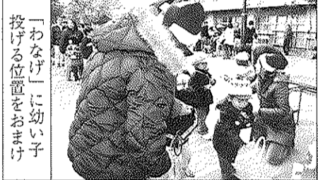
「わなげ」に幼い子投げる位置をおまけ