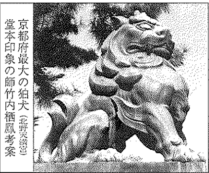
京都府最大の狛犬(北野天照堂) 堂本印象の師竹内鶴鳳考案