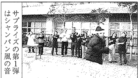
サブライズ風の第一弾はシャンパン風の音

北側にはすごいデモンスター用用のデコレーションケーキができています。子どもたちが受け取るケーキは小さいが「安くておいしい」と定評がある。その東隣には、じゃんぼなお好み焼きが、いい匂いを発散させている。「よいしょ」とばかり、アルバイトサンタさんがわざわざやってきて、ひつくりかえす。2時間開会後の進行が早く、日暮れが遅く感じられる。やとと暗くなると、イルミネーションを点灯するカウントダウンが始まる。ほんとうのサンタが空から、プレゼントの袋をレールで滑らせてくる。ほんとうのサンタからのメ