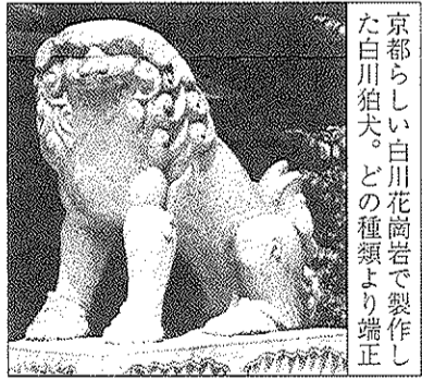
京都らしい白川花崗岩で製作した白川狛犬。どの種類より端正

狛犬の特徴は、江戸狛犬が箱型の尻尾、または、根元から左右に分かれる二分尾に対し、浪花狛犬は尻尾が特徴で、垂れ耳が多い。丹後、出雲狛犬の尻尾は棒状で尻から頭のほうへと斜めに立ち、表面に円状の巻き毛模様がある。浪花狛犬を華やかにしたのが、京都らしく美しい白川狛犬である。狛犬の文化圏は、京都府北部が出雲狛犬圏、南部が浪花狛犬圏、京都市が白川狛犬圏となる。「狛犬」はみんな同じとしか頭に