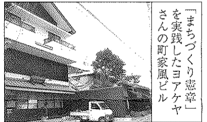
「まちづくり憲章」を実践したヨアケヤさんの町家風ビル

平成19年の修徳消防分団の出初式は、1月7日(日)午前10時15分に開始された。当日は暖冬という予報に反し、じょうやくに寒く、雪が舞うなか、学区民にみづめられながら、分団旗を先頭に出動し、手帳点検を受けた。出初式は消防分団の防災力の象徴である。しかも、修徳学区は平成13年1月23日以来、6年間無火災の快挙を打ちたて、現在その記録を更新中である。