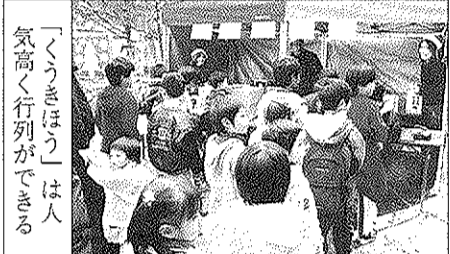
「くうきほう」は人気高く行列ができる