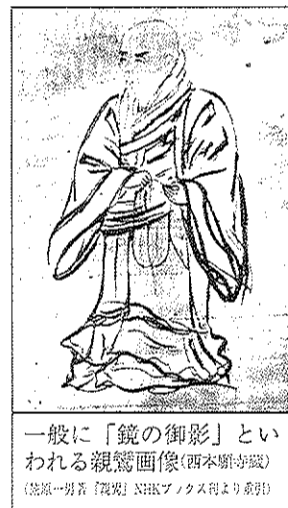
一般に「鏡の御影」といわれる親鸞画像(西本願寺蔵) (流原一男著『親鸞』NHKブックスより引用)

昨年11月下旬、親鸞を宗祖とする本山のひとつである、滋賀県野洲市中主町木部の錦織寺に参拝した。広々とした田園地帯の中に百メートル四方の白い土塀に囲まれたお寺であった。報恩講の法要に参拝したあと、天安堂に移動し