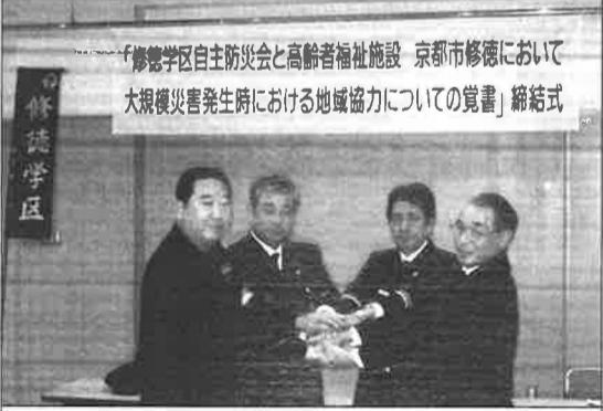
「修徳学区自主防災会と高齢者福祉施設 京都市修徳において 大規模災害発生時における地域協力についての覚書」締結式