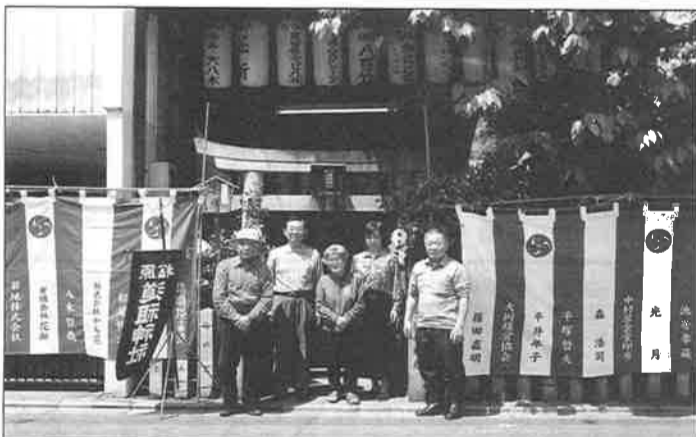
古代、和泉式部と道命あじりの由緒もある道祖神社を周囲の町の人たちが守り続けている。