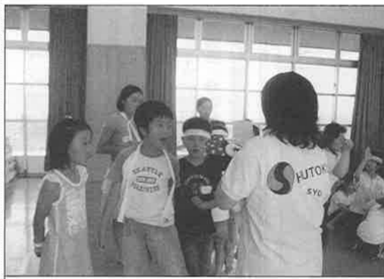
修徳せんだんホールは、59人の大家族が一緒にカレーを食べゲームをして楽しんだ。ゲームの合間もスタッフのお母さんと話がはずむ。

も、沢山あります。例えば、児童が、習い事や友達の家との行き来など、午後6時頃まで続きます。そこでわれわれは子どもたちの交流を通じ、互いに顔見知りになろうと考えました。そうならば、スーパーの買い物も、仕事中の納品もすべて、パトロールに早変わりと言いますが、あたりのお客