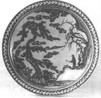
伊万里「染付樹下人物図鉢」

骨董屋をはじめ、随分の月日が流れた。一口に骨董屋と言っても、そのジャンルは広く、わが国には実に多くの