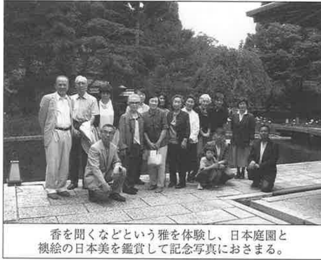
香を聞くなどという雅を体験し、日本庭園と襖絵の日本美を鑑賞して記念写真におさまる。

を「聞いて」（香道では香りを「嗅ぐ」と言わず「聞く」と表現するそうです）その違いを判断する組香という一種のゲームに挑戦です。殆どの方が初体験のようでした。見事組み合わせを当てられた方もおられ、1時間程の短い時間で、日常ではなかなか味わえない雅なひと時を楽しみむことができました。その後、日本庭園内の