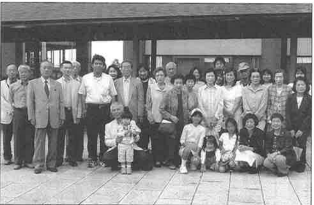
びわ湖温泉の旅行「紅葉」と料亭「八景亭」での食事と、いろいろな温泉やびわ湖の景色を楽しみ、心も体も癒すことができました。

歴史を有する焼き物である。とりわけ草創から元禄期辺りまで、古伊万里の最盛期である。当時江戸時代といえは今日と違い、身分社会が確立し、諸大名の贈答品として、また外貨を稼ぐ輸出品として、数多くの名無き陶工が懸命に製作し続ける。大名の注文品である、わずかな間違いがあってもお手打ちにされる緊迫感の中で、多くの美術品が生まれた。そんな多くの先人たちが残してくれた正に血と汗と涙の結晶を慈しみ、また後世に残し伝えていく。私は古き良きものを次代へ繋ぐ、リレー選手であり続けたい。