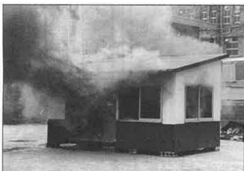
てんぷら油の加熱による火は、火柱が窓や入口から噴出した。恐ろしさを実感した。

「お知らせ安心京都メー」による6月1日から12日までに28件のカバン等のひったくり事案が発生しています。大半が自転車の前カゴに入れたカバンを、後方から来るバイクやスクーターの男にひったくられていま