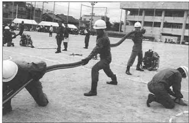
下京消防団総合査閲の「ポンプ操作」では、ロープの金具が故障するハプニングが起きたにもかかわらず、その後の操作を敏捷にこなし、抜群の能力を発揮することができた。

防火活動ができる訓練も、団員すべてが自分の仕事をもちながら、時間を割いてくれている。平成19年5月20日(日)下京消防団総合査閲では、その成果が十分に発揮された。手帳点検について、小型動力ポンプ操法の訓練では、ロープの金具が突然動かなくなるハプニ