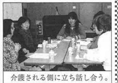
介護される側に立ち話し合う。