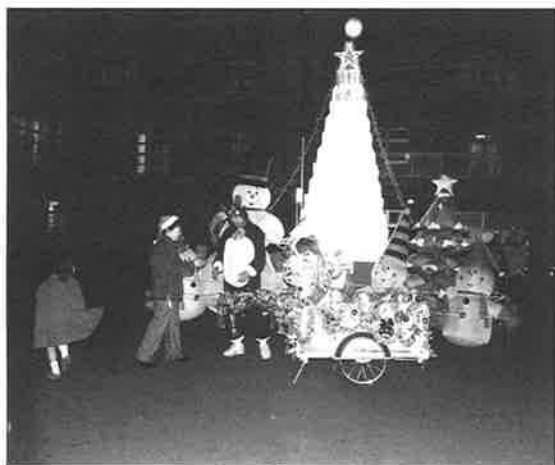
サンタトナカイがプレゼントを配達 ペットボトルツリーの前で

★クリスマス会★ 12月21日(日)午後1時30分より修徳ふれあい 今年の少補のクリスマスは例年修徳公園内の木々の電飾に代わるクリスマスらしい新しい演出が他に無いか、エコをテーマにしたものはないか、子供たちが今までに見たことがないような思い出しに残るようなクリスマスにしようと考えたのが今回のクリスマスです。