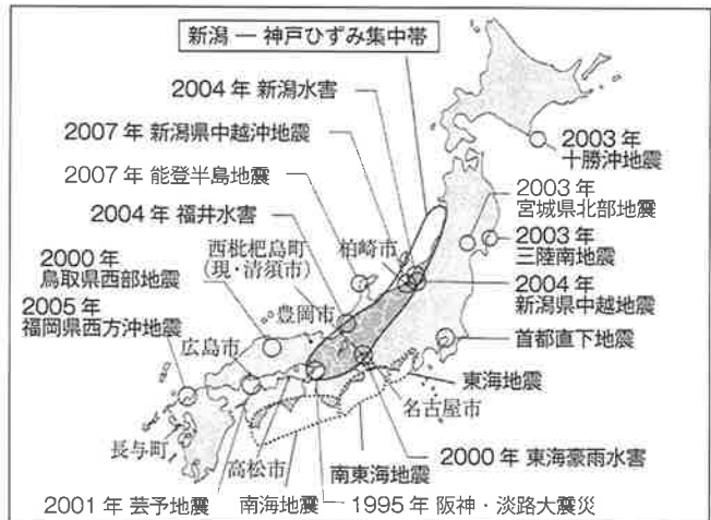
災害地名と全地球測位システムで見つかった「新潟―神戸ひずみ集中帯」家屋の耐震化など進めたい

修徳公園に避難してきた学区民は、安全かどうか、火災の発生状況などの情報の確認と伝達を、自主防災会に依存することになる。大火が周囲に迫ってこない限り、広域避難所の梅小路公園に行く必要はない。修徳公園に食糧も配給される。マンション住民のみならず、修徳自治連合会に入らなければならない。防災訓練に参加して、避難所