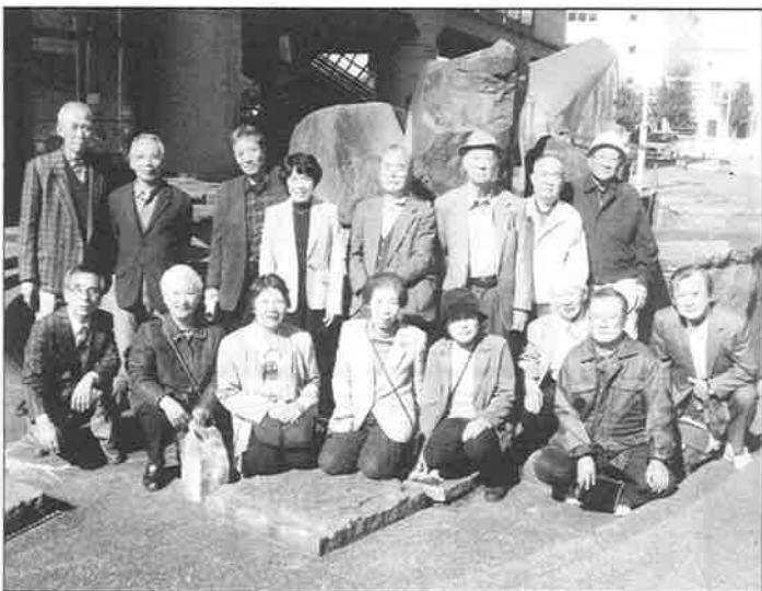
展示会に参加したメンバーです

2月上旬のテレビニュースは、オーストラリアが46度の猛暑に襲われ、山火事が広がって、大変な被害がでたことを伝えていました。日本の夏の猛暑も、このところ何年も続いているオーストラリアの早魘と、同じ大気の影響だと聞きました。46度の猛暑になると、熱中症や熱帯の感染症などの北上で、健康被害が予想されます。