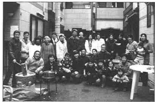
餅つき会に集まった材木町の方々

★第7回 グラウンドゴルフ大会★ 11月9日(日)、体育振興会主催のグラウンドゴルフ競技会が、格致小学校校庭で行われました。7チームの参加で、和気満々と楽しくゲームを楽しみました。このスポーツは年齢に関係なく誰でもできます。来年も多数の方の参加をお待ちしています。結果は下記のとおりです。