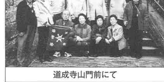
道成寺山門前にて

修和会 紀州路の旅 群立するなか遊歩道を海岸に出て、少々きつい螺旋階段を上がりきると展望台。10メートル以上はあると思われる風のか、目の前には日高、有田の岬。その後に延々と海岸線の出入りが連なり、中央はるか彼方に淡路島、左には鳴門、徳島まで海は茫洋。圧巻。壮観。心ゆくまで楽しんで下りた。