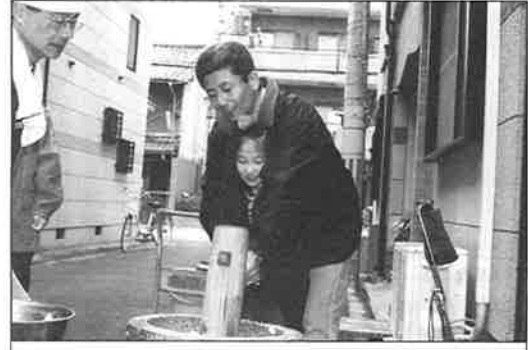
重たい杵でお餅をついています

暮れも押し詰まった12月28日(日)材木町の町内餅つき会を見せてもらいに行きました。準備は2日前から始め、40kgの餅米を水に浸けておき、杵や臼、セイロなどは前日に洗って用意されました。当日48人の町内の人が集まり、朝9時頃から米を蒸す人、米をつく人、臼取りをする人、餅を丸める人などに別れ全員で作っておられました。出来上がった餅は、そのままきな粉にまぶしていただいたり、豚汁に入れていただいたりしました。材木町の方々とは3年前からやっておられるので、やわらかくて味もすくおいしかったです。準備したり、作ったりするのは時間も労力もいるので、敬遠する人もいますが、材木町の方々には和気あいで楽しんでおられました。作った餅は町内31世帯に配られました。杵や臼、セイロ等の道具は修徳自治会が所有しているので、他の町内でも使用出来ます。町づくりの一助としてなされたらどうでしょうか。