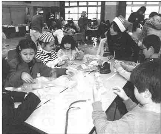
ペットボトルとのりやテープで こんな物作れるよ