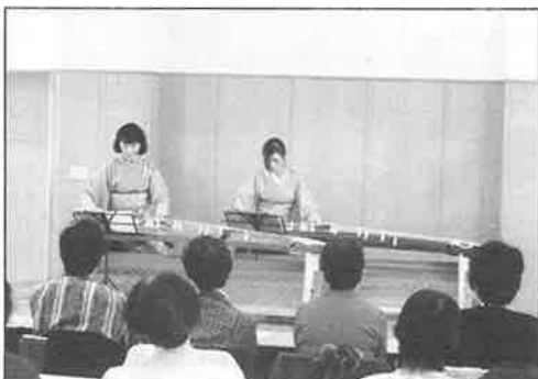
生田流のお琴の調べにうっとり

越しを頂けることになり、とても感激しております。そしてお茶会のお菓子は、玉津島町の末富様がこの日のために、今年の丑年にちなみ、北野天神様の梅をアレンジして創作して下さい、「北野の春」と名付けられたとても立派なお菓子でした。役員様のお茶の用意、町役員様のおはこびの役割も決まり、皆様の用意万端、意気の合ったところでお琴の演奏が始まりました。