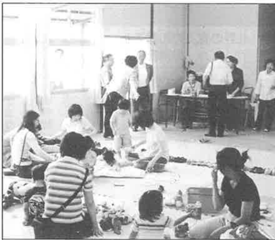
親子で楽しく遊んでいます

好天に恵まれた1月27日(火)第三回「ラッコくらぶ」が開催されました。寒い日にもかかわらず、11組の元気な親子の方たちが参加して下さいました。 初めての方、二度目の方達と顔ぶれも様々ですが、皆さんすぐにうちとけて、楽しいひと時を過ごされていきました。 格致、修徳、成徳の3学区の民生委員、主任児童委員の方々の、地域のみんで子育てのお手伝いをしようという熱い思いから立ち上げました。使わなくなった玩具、児童館で借りる絵本、そして、毎回成徳の主任児童委員さんが折って来て下さる沢山の動物の折り紙(これは来て下さった)