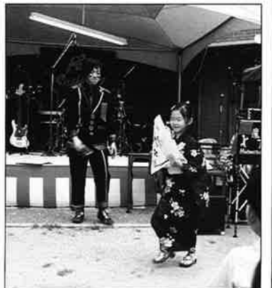
アキット君にもらった