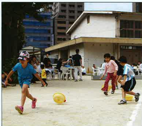
小学生もがんばっている