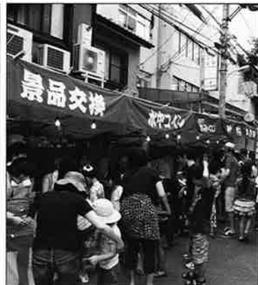
少補の屋台のにぎわい