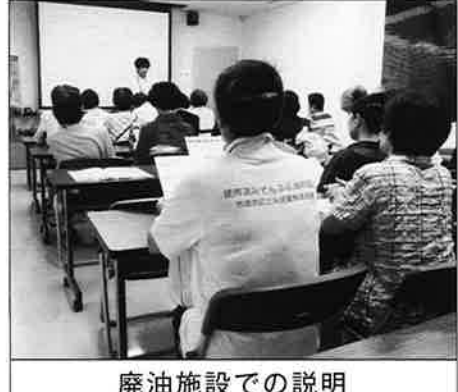
廃油施設での説明

はじめに京都市横大路学園を見学させていただきました。山と積まれた容器包装プラスチックの「ごみ搬送コンベア」から流れ出てくるごみを、学園の