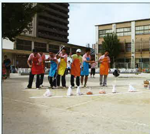
男性の方がスゴイ