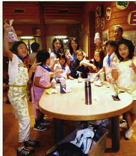
ウイナーできたぞ！