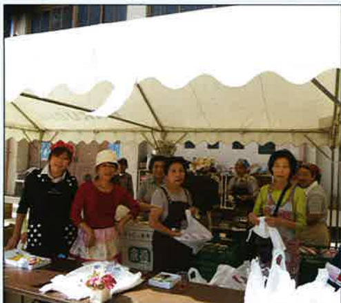
模擬店も盛況です