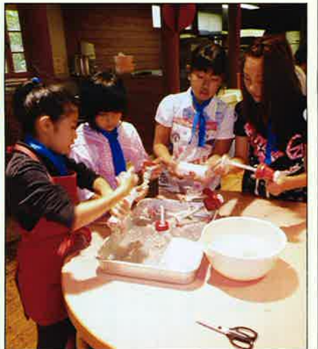
ウイナー手作り風景