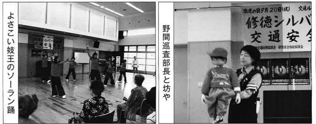
よさこい妓王のソーラン踊

開催終了後、修徳交対協委員が集り、今後の行事についての会議を持ち、継続して地域住民の安全のため、力を合わせ活動していくことを確認いたしました。