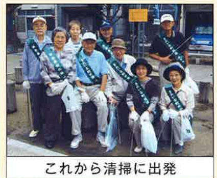
これから清掃に出発

とりくみとはなりました。が、長年住み慣れた修徳学区の道路(新町〜五条〜烏丸〜松原〜小田原)を清掃しました。途中、玉津島神社の境内で一服し、神社を守る町内の皆さんの苦勞もお聞きしました。修和会も年中、様々な行事にとりくみますが、このように全国の行事にとりく