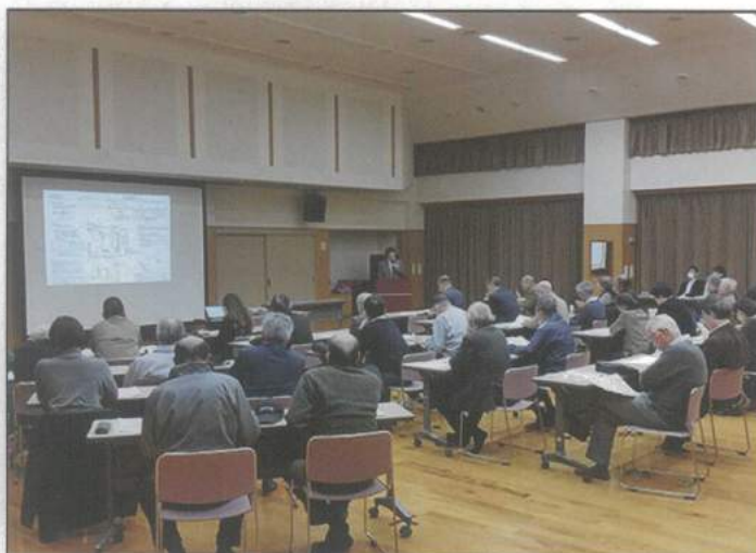
民泊トラブル回避に関する講演会

▼本年度より修徳新聞の発行を年3回から2回とするを昨年度末の自治連合会理事会で提案し承認していただいた。連合会助成金を抑えることが目的だ。本号はカラー4面、白黒2面の変則構成となったが今後は記事の集まり次第で紙数を減らし、なるべく出費を抑えたいと思う▼さて本号校正作業中の9月4日、台風21号が近畿を直撃した。拙宅敷地内は風で飛ばされてきた様々な物が散乱している。どうやら修徳学区でも物的被害が出ているようだ。次号新聞に人的被害の記事が出ない事を祈ります。