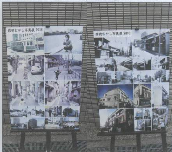
まちづくり委員会 むかし写真展

おなかを満たしていただくかと思いましたが、途中かき氷とソフトドリンクが売り切れてしまいスタッフ並びにお客様にご迷惑をおかけしてしまい反省しております。来年以降は改善していきます。 しかし、大きな事故はなく、心配された食中毒もなく終えられたのはボランティア参加された全ての方々のご協力のおかげだと思います。 皆さん本当にありがとうございました。