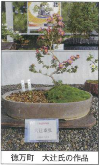
徳万町 大辻氏の作品

雨あがりの11月6日、10時。地下鉄五条駅から植物園の菊花展へ向かう。総勢40名の修和会会員。北山駅を降りると早速入園する。目の前鮮やかなコスモスが満開で迎え