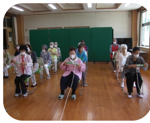
すこやかサロンでのゲーム 「ウサギとカメ」