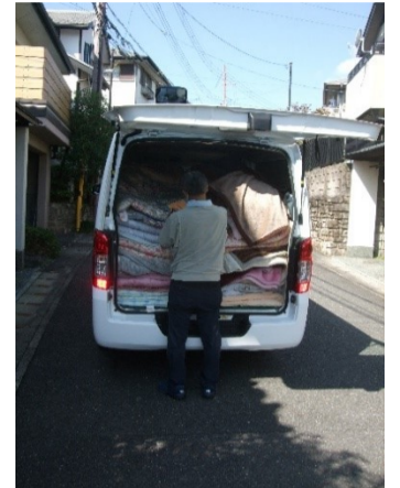
布団クリーニング、2024年は10月30日31日に行います。