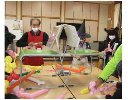
桂坂小学校PTAフェスティバルにて、犬とサーベル合わせて700個のバルーンを作りました。