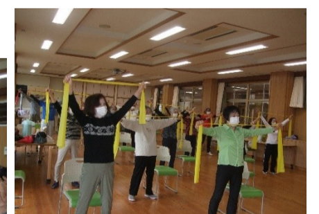
筋トレ教室 (クローバーホール) 概ね 第2日曜日 10:00~