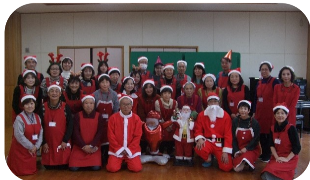
クリスマス会時のボランティアの皆さん