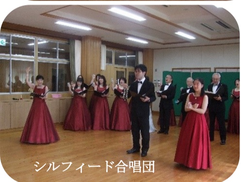
シルフィード合唱団