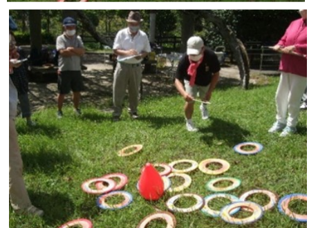
スカイクロス (ふれあい公園) 第1・第4水曜日 (10:00~)