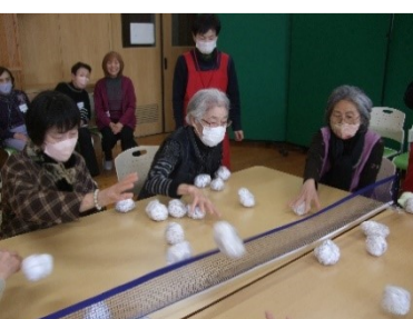
すこやかサロン (クローバーホール) 概ね 第3土曜日