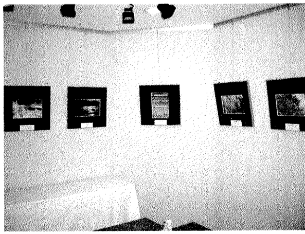
現在展示中の写真同好会会員の写真

進んでいくことが重要であると思われるので、自治会員の皆様におかれましては、何とぞよろしくお願ひ申し上げます。