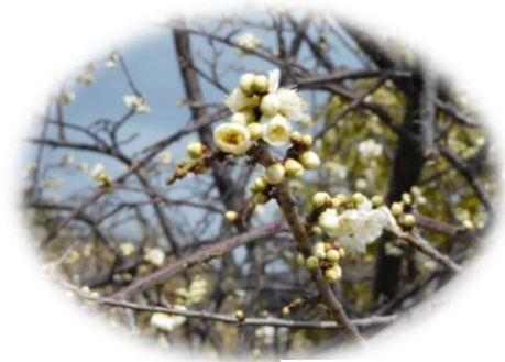
きさらぎ公園の白梅