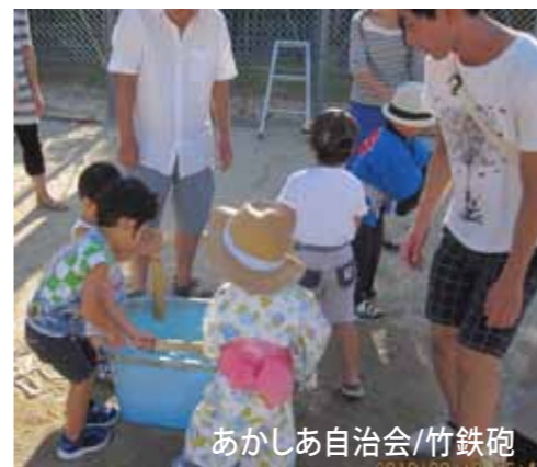
あかしあ自治会/竹鉄砲