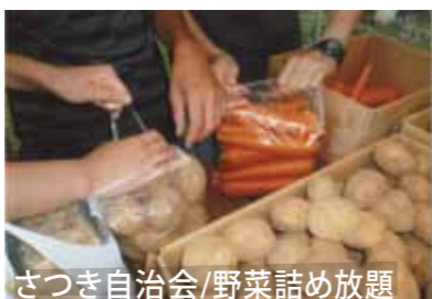
さつき自治会/野菜詰め放題