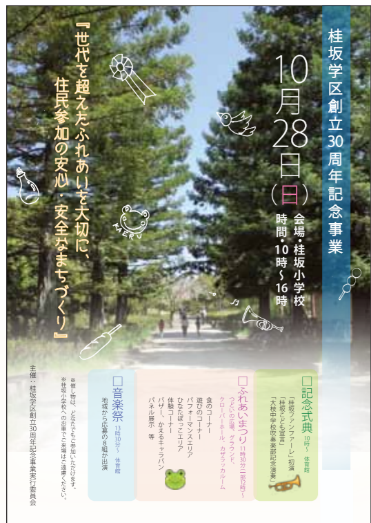
30周年記念事業告知ポスター

桂坂学区創立30周年記念事業の記念式典・ふれあいまつり・音楽祭をご案内するポスターが各所に掲示されました。式典やまつり当日まであとひと月あまり、準備は大詰めをむかえています。記念事業の企画運営には、歴代の自治会長をはじめ、各種団体の所属の方、有志の方、また桂坂内の保育園や福祉施設、小学校、中学校の関係各位の方のご協力を得て進められてきました。