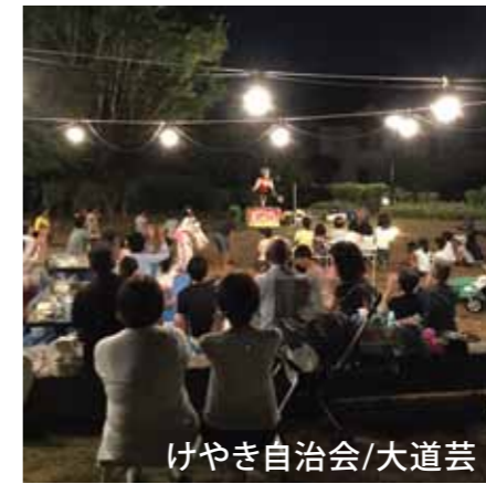
けやき自治会/大道芸