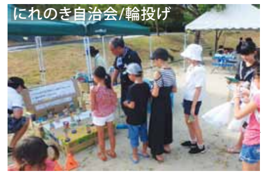
にれのき自治会/輪投げ