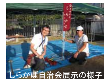
しらかば自治会展示の様子

体験会は人の集まる演奏会前の30分間で、暗くなる前に終えてしまうこと。しらかば自治会に所属する自主防災会常任幹事の二人を先生に、実際に道具の使い方のレクチャーを受けました。コンクリートブロックを割ったり、鉄筋を切ったり、リヤカーを引いたり。夏祭り会場のアットホームな雰囲気の中、子どもたちも普段見慣れない道具類に興味津々で大人の手を借りながら、とても積極的に取り組まれたようです。実際に体験する事