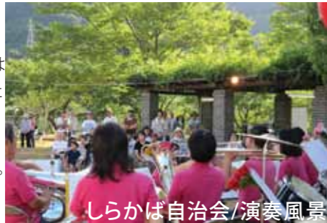
しらかば自治会/演奏風景