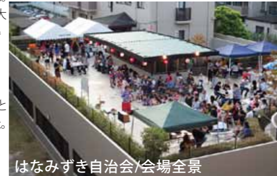
はなみずき自治会/会場全景