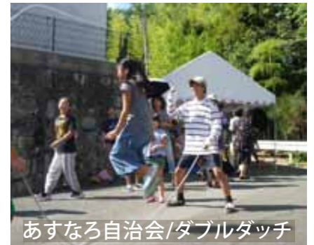
あすなる自治会/ダブルダッチ