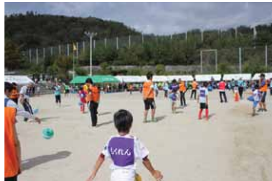
リフティング競技

お蔭様で子どもたちからお父さんお母さん、そしておじいちゃんおばあちゃんまで多くの世代の方々一堂に集まり家族の絆を確信され、又、ご近所の皆様方と共に汗をながされ共に楽しく過ごされコミュニケーションの充実を更に深められたと思います。