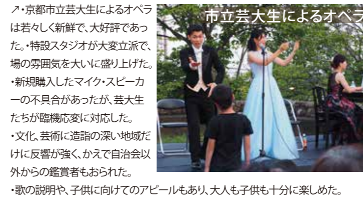
市立芸大生によるオペラ