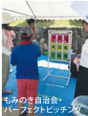
もみのき自治会・パーフェクトピッチング