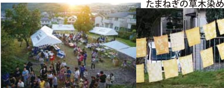
たまねぎの草木染め