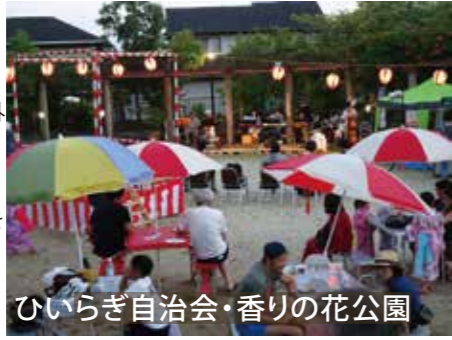
ひいらぎ自治会・香りの花公園