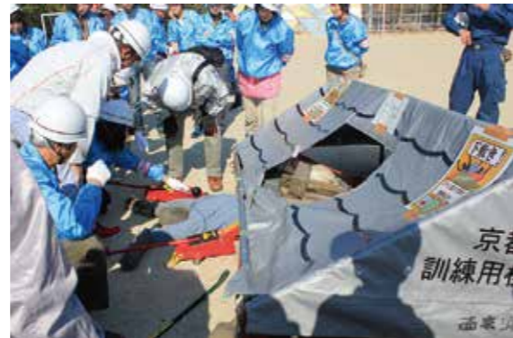
2018年度 倒壊家屋からの救助訓練

自分自身やご家族の安全が確認出来たら、助けを必要とされておられるご家庭がないかご近所の確認をお願いします。或いはご自身やご家族の救助に支援が必要なら助けを要請してください。 災害時に円滑に助け合いができるように日頃からのコミュニティが必要 となります。過去の大震災で一番多く人命を救助したのは地域住民による共助だったというデータがあります。地域被害を最小限に留めるために地域一丸となつての取り組みが必要です。