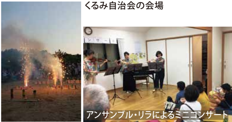
くるみ自治会の会場