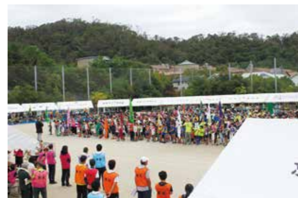
昨年度の開会式の様子