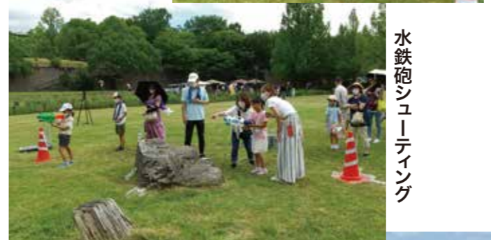
水鉄砲シューティング