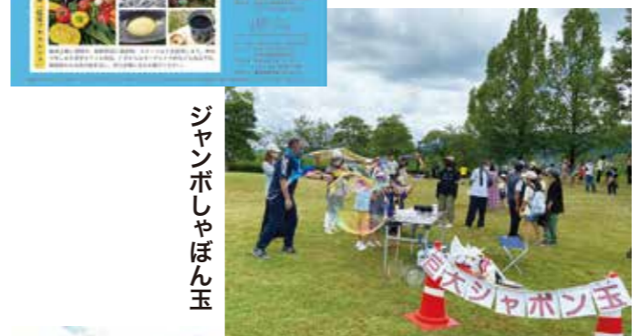
ジャンボしゃぼん玉

イベントでは木々に囲まれ芝生の広がる桂坂公園の持ち味を生かしたゲームや体験コーナーを企画しました。スタンプラリー対象のゲームコーナーでは、木々に張り巡らされた紐の間を通り抜けたり、芝生の