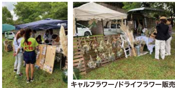
キアルフラワー/ドライフラワー販売