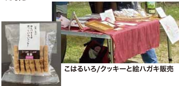
こはるいろ/クッキーと絵ハガキ販売

桂坂住民による出店も歓迎です。趣味で作ったもの等を販売してみませんか。また、演奏やパフォーマンスの披露も歓迎いたします。