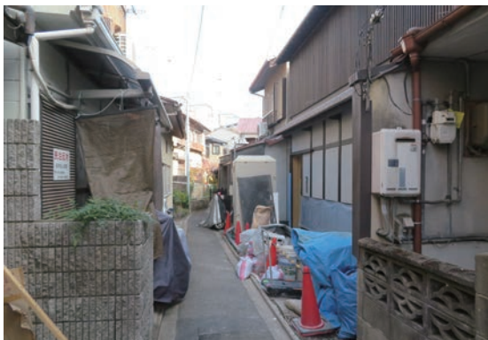
細街路沿いに工事中の民泊

民泊の立地によって、ゴミ問題、大声、掃除をしない、雑草がぼうぼう、スタッフの路上駐車など色々な問題が起きはじめました。民泊の事業者は海外が多く、改善を申し入れてもうまく伝わらないことも多々ありました。