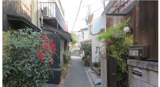
建築協定による民泊規制を導入することになった東山区常盤町のまちなみ。4ページに記事があります。

また、私の住む桂坂にれのき北・南地区では、住民の合意形成を軸に約3年間にわたる活動を展開し、京都市長への要望書提出を経て、京都市内の住宅地