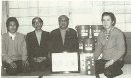
表彰の記念品と 町内会役員

去る六十二年三月三日の「消防記念日」に、当材木町町内会が、自治組織市長表彰を受けました。下京区より四ヶ町が選出され、市長出席のもとに表彰状及び副賞として、防火用ポリバケツ一〇ヶを頂戴致しました。これは、町内会の皆々様が、日頃防火の為に精進努力した結果だと存じます。今後、益々防火に対する意識を高めてゆきたいと考えております。(小畑記)