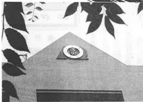
△燦然と校章はもう輝いています。(学校正面入口の上)

正面の囲いには、いかめしく、まだまだ。建物東の方から眺めると、なかなか立派なものです。色調がガラリと変わって、タイルは黄色になり、窓も、先の南側は外壁から部屋は少し入って造られてありますが、こちらは、直接太陽が入ります。沢山の窓のため、教室はさぞ明るいことでしょう。