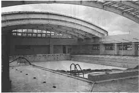
△開閉式ドームのついたプール(4F)も着々と工事は進行中。