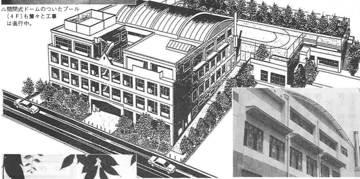
出来上がったら、こんな学校になるのですね。(想像図)