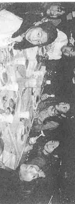
自分で焼いたホットケーキ、ひと味違う

十一月二十五日(土)、下京ラネットサークルは今年度二回目の催しを洛央小学校ラウンジにて行ないました。