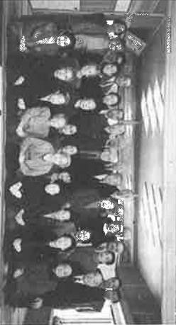
十一月七日恒例の「菊展」を観賞に行きました。当日はさわやかな秋日和に恵まれ、三十名の参加者は、午前十時地下鉄にて植物園へ。丹精こめた色とりどりの、また数々の大輪の菊の花を目の前にして一同今更ながら、その出来ばえに感服しました。