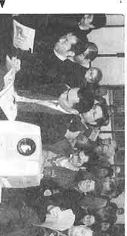
自主防災会研修会で、熱心に検討に参加するみなさん