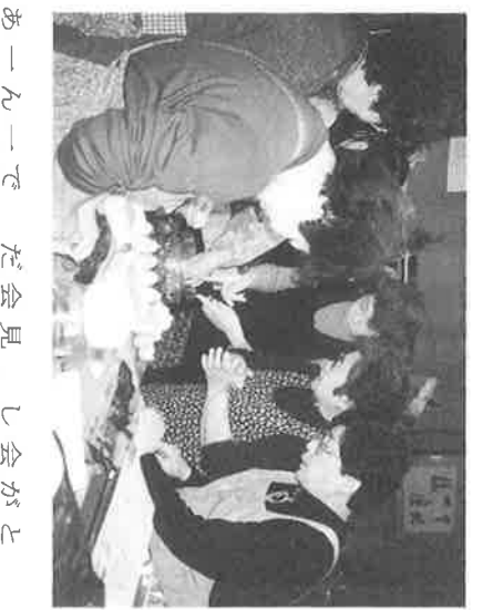
ひとり暮らし高齢者食事会に参加して

題が社会的な注目を集めるなかで、少年の健全な活動である。『長年にわたる献身的な活動』と力説した。篠原会長は「PTAや学区の自治連合会の活動とや万引きが多かった。時代が下るにつれ、校内暴動して、スポーツや清カやシブナの乱用へと横田府医師会長の推薦言葉によると、篠原会長の決め手は、昭和三十四年五少年補導委員長就任以来の解決にもならない。学