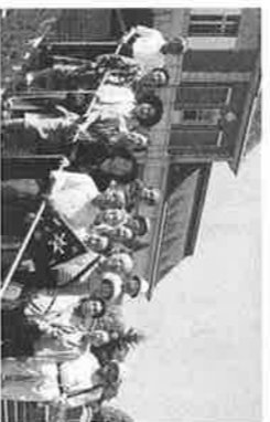
今年も快晴 研修旅行

6月8日修徳和会春の研修旅行。まず最初の下車地は花と果実のふれあい神戸市立フルトンプラザ。都会の汚れに慣ら