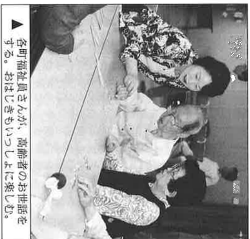
各町福祉員さんが、高齢者のお世話を ▲する。おはじきもいっしょに楽しむ。