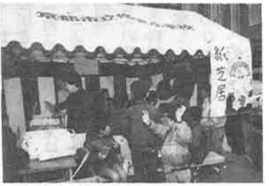
昔懐かしい紙芝居