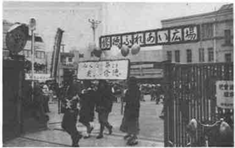
小雨もなんのその