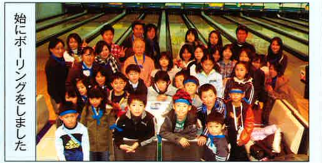
始にボーリングをしました

修和会秋の研修旅行 りんご狩・天竜峡十勝めぐり 少々冷え込んだ11月19日早朝、八条口出発のバスは市内の渋滞に知らぬ間にうとうととしてしまい、目が覚めた時には近江平野をひた走っていました。八日市、多賀、彦根を過ぎると伊吹の下を東の空へ快走。養老で休憩の後、濃尾平野の視界が開け、左遠方に雪を頂く御嶽山