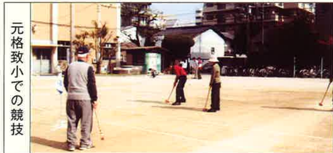
元格致小での競技