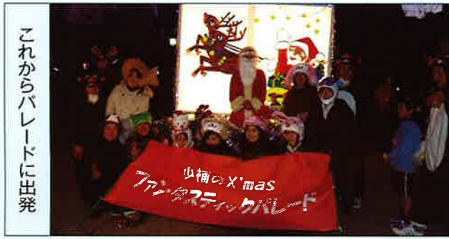
これからパレードに出発

ゆ・る・り・と、大きな行灯(あんどん)が夕暮れの街に動き出した。修徳少年補導委員会企画のクリスマスパレードが修徳公園からスタートした。2,000wの電球で点灯され、イルミネーションで飾り付けられた行灯の両面には、トナカイが引くソリに乗ったサンタクロースのイラストが光り輝いている。「まるで青森県のねぶた祭りのようだ」と声が聞こえた。 先頭はクリスマス・ファンタスティック・パレードの垂れ幕。それに続き、行灯フロート。引くのは2匹のトナカイ、ほんものではない。支部役員がトナカイの着ぐるみを身にまとい引っ張っている。そして、サンタが行灯フロートに乗って笑顔で手を振っている。笑顔のサンタも支部役員である。その後には、動物・魚・雪だるま・ケーキなどのデフォルメされた帽子をかぶった支部役員がパレードを盛り上げる。そして沢山のおみくじを吊るしたクリスマスツリーを乗せたフロートが続く。ツリー・フロートを引いているのも2匹のトナカイ。ツリーに吊るされた“おみくじ”には女性支部役員手作りのオーナメントが付けられ、運勢内容も手作りでクリスマスにちなんだものになっている。子供たちは、おみくじのオーナメントを見比べ、気に入ったものを一人一人ツリーから外し受け取った。 パレードは修徳学区を南から北、西から東、北から南、東から西へと進む。その途中、「サンタ・ジャンケン」が集まった子供たちとサンタとで始まる。♪サンタジャンケン・ジャンケン・ポン♪の掛け声でにぎやかに行われた。サンタに勝った子はサンタからプレゼントをもらい嬉しそうに顔で、負けた子は次のサンタ・ジャンケンに期待を寄せて一緒にパレードに付いて行った。 パレードが進む道々では、各家の前で待っていたおじいちゃん、おばあちゃんや家族の人たちが手にデジカメやビデオカメラを持ち、にこやかな顔で迎え楽しそうに眺めていた。 ゴールの修徳公園では、サンタからのサプライズプレゼントがあった。大きく膨れたサンタの袋から、色とりどりの風船をサンタが一人ずつ子供たちに手渡した。いっせいに割るとその中からクリスマスツリーのシールが貼った当りの紙が…。当たった3人の子供には、両手で抱えられないほどのお菓子やおもちゃなどいっぱい詰まったプレゼント袋が渡された。 パレードの前には、午後2時からボーリングイベントを山科MKホールで行った。子供大人合わせて37人が戦いの火ばなを散らした。なかなかの高得点が出たようだ。結果報告では、軽食と飲み物が渡され、上位3人には景品が渡された。その後、参加者全員がパレードと一緒に歩いてくれた。 今回、クリスマスイベントに参加してくれた方々、街角で応援してくれた修徳学区の皆さん、裏方さんで汗を流してくれた方々、すべての人が笑顔いっぱい楽しんでいただけたことに嬉しく思います。ありがとうございました。