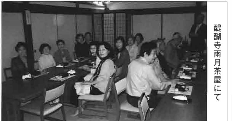
醍醐寺雨月茶屋にて