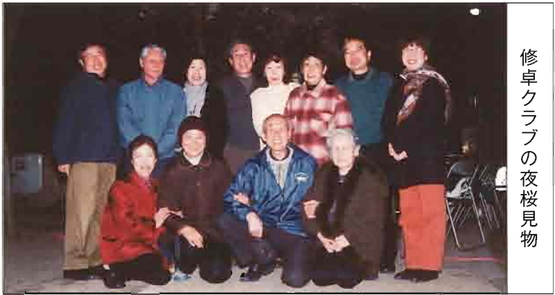
修卓クラブの夜桜見物

修卓クラブのお花見会は今年で3回目です。3月31日(水)に参加者12名で夜桜の宴を楽しみました。