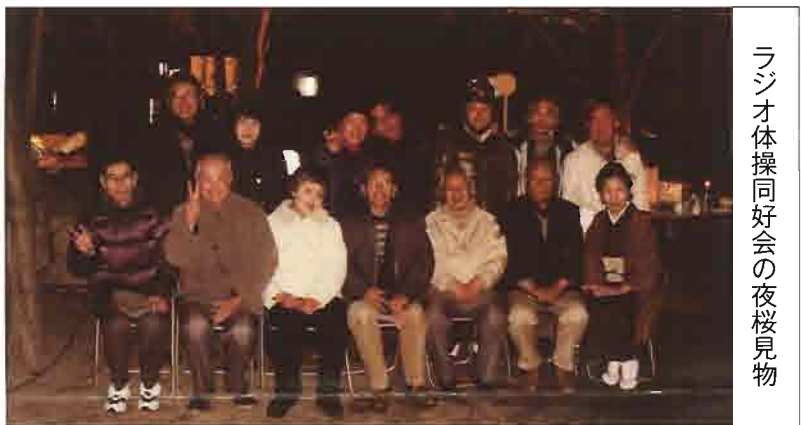
ラジオ体操同好会の夜桜見物

続いてのお花見会は4月2日(金)ラジオ体操同好会が、参加者17名で盛大に美しい桜を楽しみました。