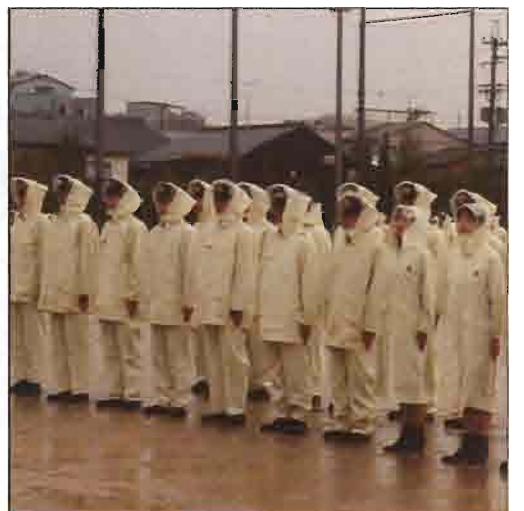
雨の中整列する団員

最後になりましたが当日、足もとの悪いところ多数の方々に応援に駆けつけてくださいました。この場をお借りして御礼申し上げます。