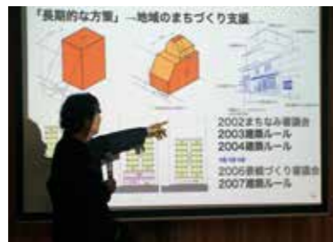
「景観」の基礎理論から政策実務まで