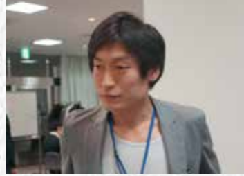
行政書士 服部行政法務事務所 京都景観エリアマネージャー4011号

建築設計の仕事をしていて、設計するときの考え方の幅を広げたいと思い受講しました。基礎理論の講座は大変わかりやすく、また歴史、文化、法律など様々な観点から景観を学ぶのは新鮮で面白かったです。