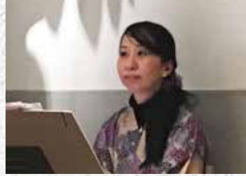
一級建築士 設計事務所勤務 京都景観エリアマネージャー2001号