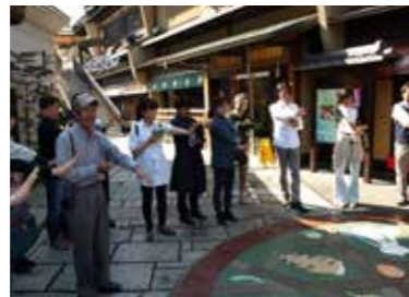
ワークショップや懇親会で新しい人脈を築けます