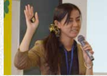
公務員 行政建築職 京都景観エリアマネージャー 2027号

全国で最も厳しいと言われる京都の景観条例は奥が深く、根本的な考え方から学ぼうと考え受講しました。今後は行政書士として地域コミュニティと密接に関わりを持った活動ができればと考えています。