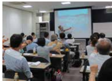
スライドを使って視覚的に学べます